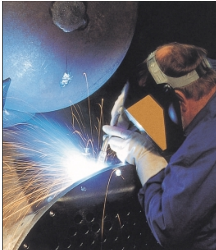
Lors du soudage semi-automatique, un arc électrique se forme entre le matériau d'apport alimenté en continu et fondant et la pièce

Depuis de nombreuses années, le soudage MIG/MAG constitue le gros des processus de soudage par fusion. Sa disponibilité universelle en termes d'épaisseur, sortes de matériau, formes de cordon et positions de soudage, explique son succès dans presque tous les domaines de l'usinage des métaux. Les récents développements dans le soudage MIG/MAG sont entre autres le soudage à fil plat, la technologie à source de courant, le soudage pulsé et le soudage au courant alternatif.